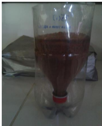
Figura 3 - Disposição do substrato